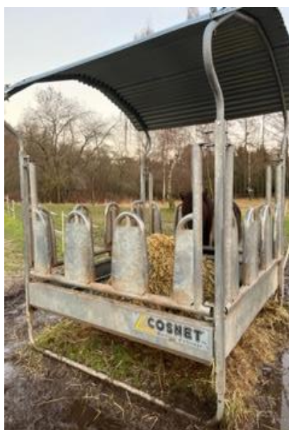
Billede af foderhæk