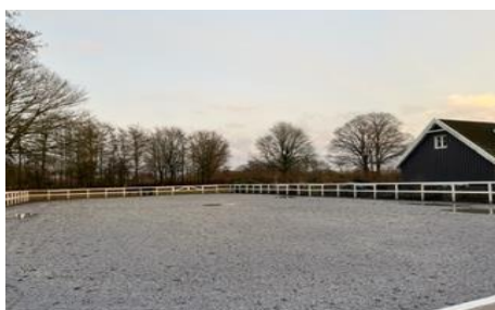
Billede af ridebane

Hesteholdet på ejendommen har karakter af hobby, og en ridebane er derfor ikke landbrugsmæssigt nødvendig, og kræver landzonetilladelse.