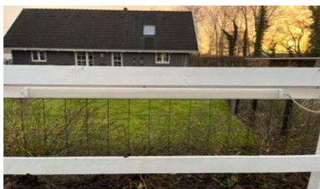
Billede af lyskilde på ridebane